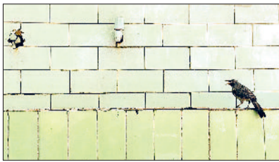
हरिभूमि न्यूज रोहताक

रोहताक लगातार दूसरे दिन भी भीषण गर्मी की वजह से तंदूर बना रहा। शनिवार को भी जैसे ही पारा फिर 44.6 डिग्री सेल्सियस पर पहुंचा तो रोहताक देश के सबसे छह गर्म शहरों में शामिल हो गया। दिन का तापमान सामान्य से 5.9 डिग्री सेल्सियस ज्यादा है। बीते 24 घंटे में जहां अधिकतम तापमान में कोई बदलाव नहीं हुआ, वहीं न्यूनतम पारा में 2.2 डिग्री सेल्सियस की बढ़ोतरी होकर यह 26.4 डिग्री सेल्सियस पर पहुंच गया। ये सामान्य से 4.7 डिग्री ज्यादा है। अब हालात ये हैं कि पूरी रात लू सकती है। अगर रात में लू चलेंगी ये मानकर चलें कि सूर्य सुबह से ही आग बरसाना शुरू करेगा। कुल मिलाकर गर्मी ने रौद्र रूप अब दिखा दिया है। आईएमडी चंडीगढ़ का कहना है कि 26 अप्रैल की रात से पहाड़ों में पश्चिमी विक्षोभ सक्रिय होगा। जिसका असर हरियाणा पर भी पड़ सकता है। यानी के लू से थोड़ी बहुत राहत मिल सकती है। इस वरतन डिस्ट्रिक्ट का असर 29 अप्रैल तक जारी रहने की उम्मीद है। अत्यधिक गर्मी होने की वजह से पीजीआईएमएस से हीट स्ट्रोक के मरीजों की संख्या भी बढ़ रही है। मेडिसिन विभाग में शनिवार को मरीजों की संख्या 350-400 के बीच रही।