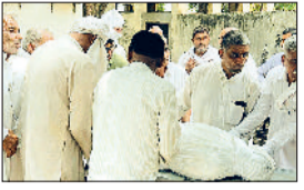
मृतक का शव ले जाते परिजन।