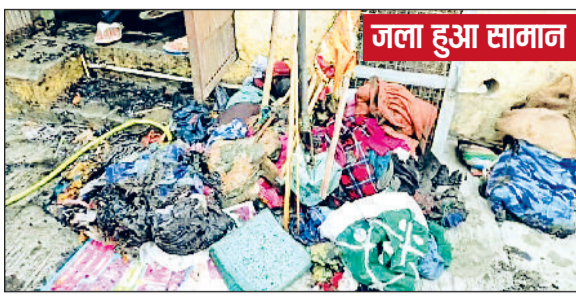
जला हुआ सामान

■ धुं से बेटा बेहोश, जिसे तुरंत अस्पताल में भर्ती करवाया गया